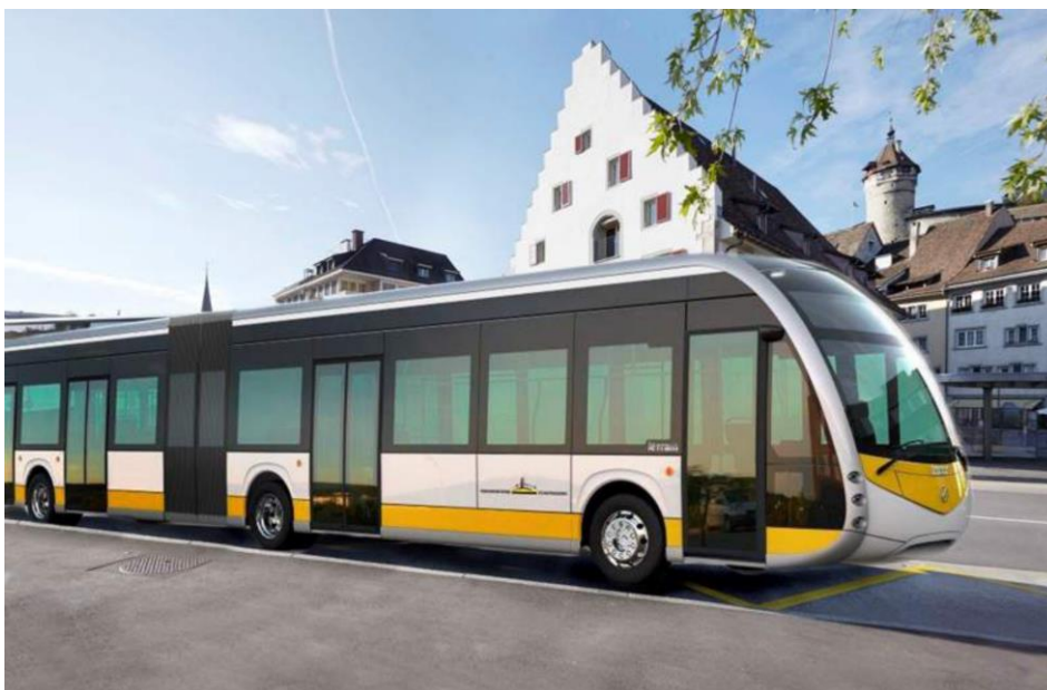
Figure 4 Visualisation du nouveau bus électrique articulé d'Irizar à Schaffhouse (Verkehrsbetriebe Schaffhausen 2019).