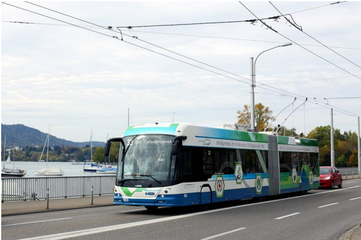
Figure 2 Le Swiss Trolley-Plus du fabricant suisse Hess qui est rechargé avec «in-motion-charging» et peut circuler près de 10 kilomètres sans caténaire (Vogel 2018).

accru et si la production de piles à combustible est encore étendue, les bus à hydrogène pourraient, à très long terme, également être utilisés (Becker 2018). Mais d'ici là, les bus à batterie et les trolleybus contribueront à réduire encore les émissions des transports publics qui sont déjà très faibles.