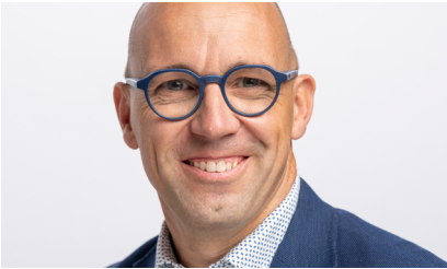
Stefan Müller-Altermatt Nationalrat Die Mitte

Die Strasse wird nicht nur von jenen finanziert, die darauf fahren. Und die Bahn zahlen auch nicht nur Bahnfahrer. Das sollte vor allem dort behoben werden, wo gewisse Benutzer viel zu wenig bezahlen. Kostenwahrheit darf in der Verkehrspolitik aber nicht das einzige Kriterium sein.